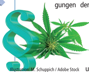
Illustration: M. Schuppich / Adobe Stock

nichtgewerbliche Eigenanbau und die Weitergabe von Cannabis zum Eigenkonsum durch